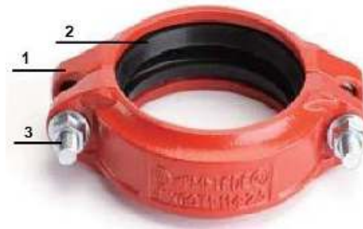
Рис.2. Жесткая муфта «LEDE».